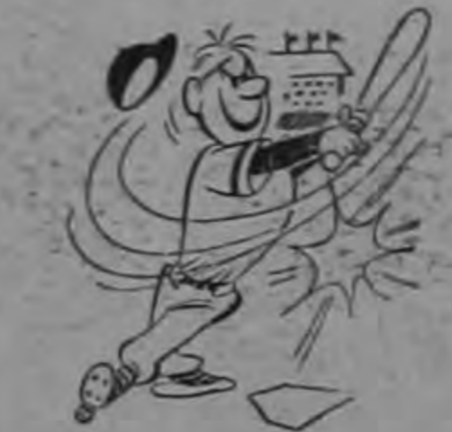
Mas tomó el grato Neuro Fosfato, y goza plena vitalidad!

Músculos, nervios y cerebro se tonifican rápidamente tomando Neuro Fosfato Eskay, el tónico probado y aprobado clínicamente. Bueno a toda edad y en toda estación.